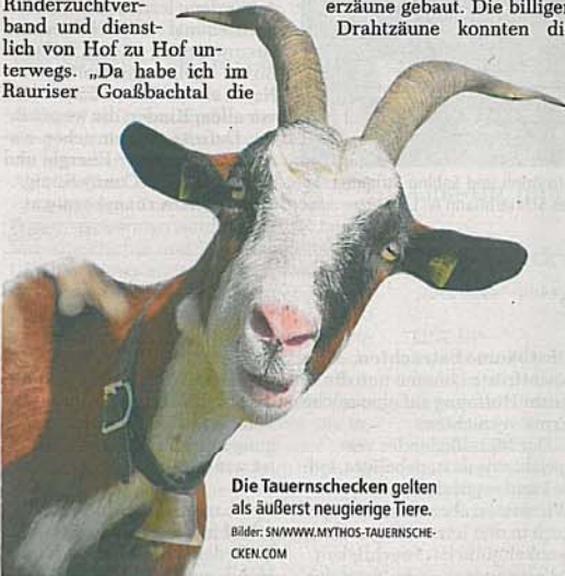
Die Tauernschecken gelten als äußerst neugierige Tiere.

Tiere nicht stoppen. Das war aber wichtig, denn die abenteuerlustigen Ziegen liefen zu den Nachbarn und fraßen dort bevorzugt den Blumenschmuck weg. „Das sorgte für viele Streitereien“, sagt Wallner. „Ganze Rassen sind so verschwunden.“